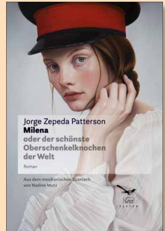
Mexikanische Literatur rückt taki mundo ins Rampenlicht