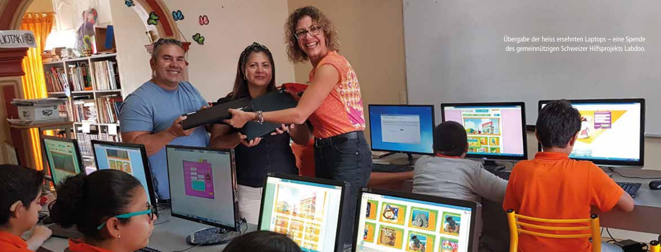
Übergabe der heiss ersehnten Laptops – eine Spende des gemeinnützigen Schweizer Hilfsprojekts Labdo.