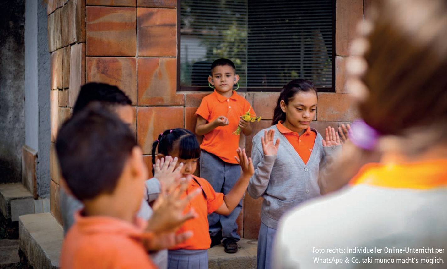
Foto rechts: Individueller Online-Unterricht per WhatsApp & Co. taki mundo macht's möglich.