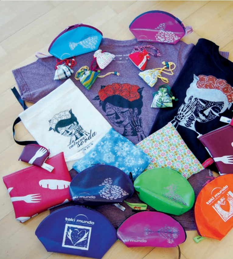
Lavendelsäckchen, T-Shirts in Leinensäcken und Portemonnaies